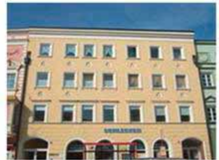
Haus außen von Straße

Objektart: Büro Verfügbar ab: sofort Objektzustand: Saniert