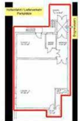
Lagerrum mit Bezeichnung neu