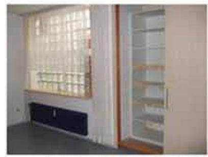
Einbauschränk und Lichtschacht