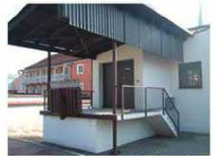
Rampe und Lastenaufzug