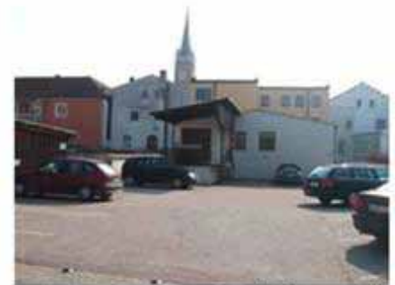
Blick zur Halle