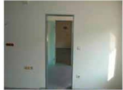
Blick BehZi 1 zu BehZi 2