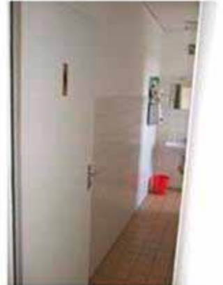
Blick zur sanitären Einrichtung