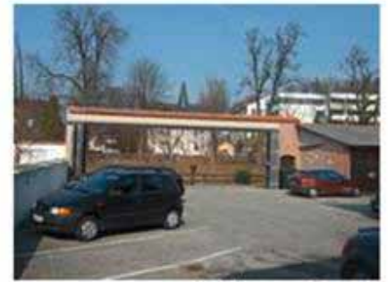
Zufahrt zur Rampe

Qualität der Ausstattung: Normal Letzte Modernisierung / Sanierung: 1973 Bodenbelag: Beton Nebenkosten: 100,00 EUR Kautiion: 750,00 EUR