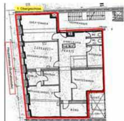
Praxis mit Beschriftung